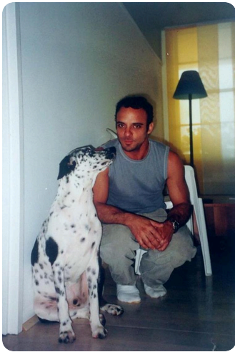
Con una de tus mascotas, la cual conocimos Abril de 2001