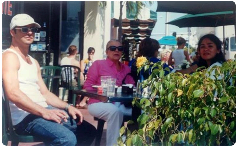
Con Cristina y conmigo....te quedas en mi corazón.