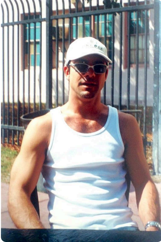
La mejor foto que te pude tomar. Fuiste siempre un excelente anfitrión siempre. Enero de 2001